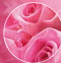
FM 217 | RÓŻA

Uwielbiasz zapach świeżych kwiatów? Teraz możesz go zatrzymać, niczym skarb zamknięty w niewielkim flakoniku. Bukiet Twoich ulubionych kwiatów, od nas – dla Ciebie.