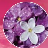
FM 211 | BEZ (lilak)