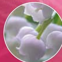
FM 213 | KONWALIA