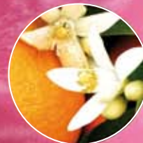
FM 218 | KWIAT POMARAŃCZY